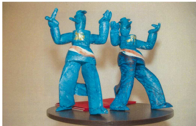
Statua „Šokac“ – rad akademika Zlatka Boureka, odljevak Ljevaonice Ujević